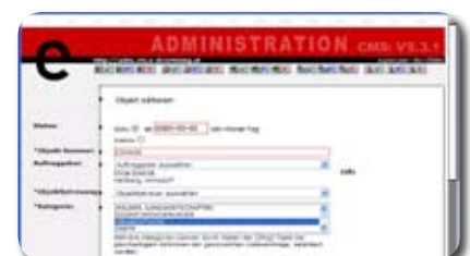
e+ CMS als Immobiliengesamtlösung, www.neuimmo.com