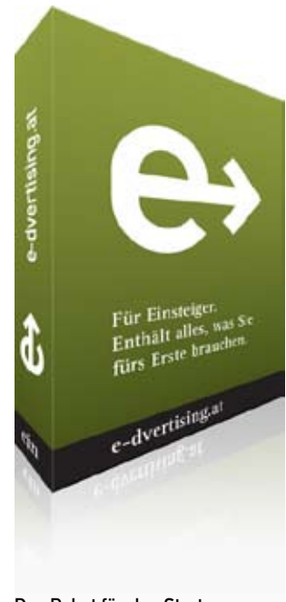
Das Paket für den Start: e-dvertising für Einsteiger

Seit über 10 Jahren produzieren wir Paketlösungen für Kundenanforderungen. Von der Beratung bei der Namensfindung, der Auswahl des Domainportfolios über die Gestaltung des Logos bis hin zur Drucksortenerstellung und der Betreuung bei Druck und Produktionsablauf. Full-Service von e-dvertising beginnt beim ersten unverbindlichen Gespräch und betreut unsere Kunden und Partner verlässlich.