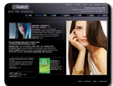
e+CMS und Suchmaschinenmarketing, www.greatlengths.de