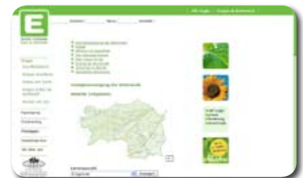
e+ CMS, www2.e-steiermark.com