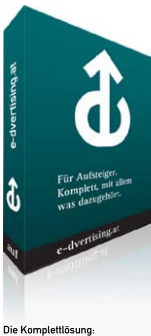
Die Komplettlösung: e-dvertising für Aufsteiger

Form und Funktion . In Deutsch statt Fachchinesisch.